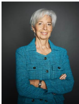
Christine Lagarde, ordförande för Europeiska systemrisknämnden

Jag är mycket glad att kunna presentera Europeiska systemrisknämndens (ESRB) tolfte årsrapport som omfattar perioden mellan den 1 april 2022 och den 31 mars 2023.