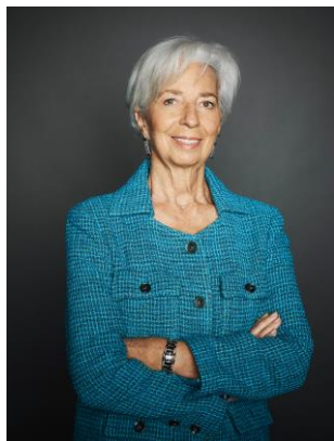
Christine Lagarde, președinta Comitetului european pentru risc sistemic

Îmi face o deosebită plăcere să vă prezint cel de-al doisprezecelea Raport anual al Comitetului european pentru risc sistemic (CERS), care acoperă perioada cuprinsă între 1 aprilie 2022 și 31 martie 2023. Raportul reprezintă o componentă importantă a cadrului CERS privind transparența și asumarea responsabilității. Prin acest raport, adresat colegiilor din Uniunea Europeană și publicului european în general, explicăm modul în care CERS și-a îndeplinit mandatul.