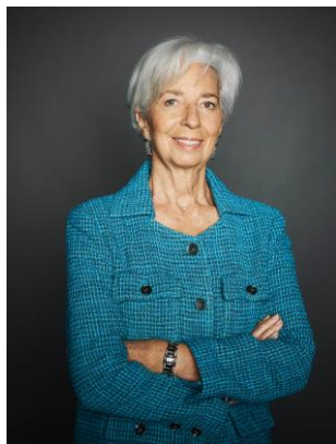
Kristīne Lagarda, Eiropas Sistēmisko risku kolēģijas priekšsēdētāja

Ļoti priecājos iepazīstināt jūs ar Eiropas Sistēmisko risku kolēģijas (ESRK) divpadsmito gada pārskatu, kas aptver laikposmu no 2022. gada 1. aprīļa līdz 2023. gada 31. martam.