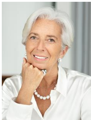
Europos sisteminės rizikos valdybos pirmininkė Christine Lagarde

Labai džiaugiuosi galėdama pristatyti vienuoliktąją Europos sisteminės rizikos valdybos (ESRV) metų ataskaitą, apimančią laikotarpį nuo 2021 m. balandžio 1 d. iki 2022 m. kovo 31 d.