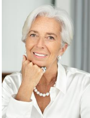
Christine Lagarde, Euroopa Süsteemsete Riskide Nõukogu eesistuja

Mul on hea meel esitleda Euroopa Süsteemsete Riskide Nõukogu (ESRN) üheteistkümnendat aastaaruannet, mis hõlmab ajavahemikku 1. aprillist 2021 kuni 31. märtsini 2022.