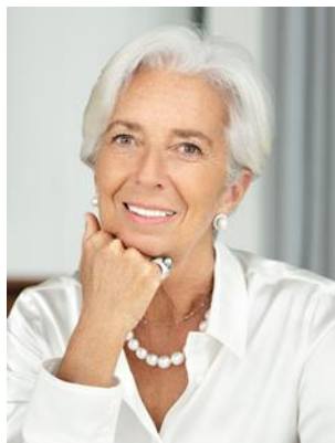
Christine Lagarde, Formand for Det Europæiske Udvalg for Systemiske Risici

Det er mig en stor glæde at præsentere den ellefte årsberetning fra Det Europæiske Udvalg for Systemiske Risici (ESRB). Beretningen dækker perioden 1. april 2021 til 31. marts 2022. Årsberetningen er en vigtig del af ESRB's kommunikation. Den har til formål at sikre gennemsigtighed og ansvarlighed med hensyn til, hvordan ESRB har opfyldt sit mandat, og er rettet til medlovgivere i Den Europæiske Union (EU) og til den brede offentlighed i EU.