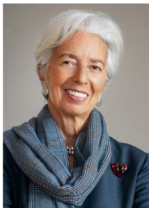
Christine Lagarde, az Európai Rendszerkockázati Testület elnöke

Az ERKT kilencedik Éves jelentése a 2019. április 1. és 2020. március 31. közötti időszakról foglalkozik. Igaz ugyan, hogy a koronavírus- (Covid19-) világválság első szakasza benne van ebben az időszakban, de a Covid19-válság gazdasági és pénzügyi következményei a későbbi hónapokban kezdtek el rohamosan felerősödni. Ezt figyelembe véve az ez évi Éves jelentésben kivételesen a 2020. júniusig terjedő időszakban fellépő kockázatokat értékeljük, hogy bemutassuk az új rendszerszintű kockázatokat, amelyek akkor jelentek meg, ahogy az európai gazdaság átment ezen a rendkívüli megrázkódtatáson.