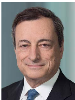
Mario Draghi, President tal-Bord Ewropew dwar ir-Riskju Sistemiku

It-tmien Rapport Annwali tal-Bord Ewropew dwar ir-Riskju Sistemiku (BERS) ikopri l-perjodu bejn l-1 ta' April 2018 u l-31 ta' Marzu 2019. Bħas-soltu, il-BERS immonitorja mill-qrib is-sorsi ta' riskju sistemiku fis-sistema finanzjarja Ewropea u fl-ekonomija. L-erba' riskji ewlenin identifikati huma l-istess bħas-sena l-oħra, bir-riprezzar tal-premji tar-riskju fis-swieq finanzjarji globali jkun l-aktar wieħed prominenti, segwit minn dgħufijiet persistenti fil-karti tal-bilanċ tal-banek tal-UE, l-assiguraturi u l-iskemi tal-pensjonijiet, sfidi għas-sostenibbiltà tad-dejn fis-sovran tal-UE, is-setturi korporattivi u tal-unitajiet domestiċi u, fl-aħħar, il-vulnerabbiltajiet fis-settur tal-fond ta' investiment u r-riskji minn attivitajiet bankarji paralleli. Dan huwa partikolarment rilevanti fi sfond ta' incertezzi tal-politika u moderazzjoni aktar mgħaġġla milli mistennija tat-tkabbir ekonomiku.