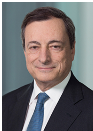
Mario Draghi, President tal-Bord Ewropew dwar ir-Riskju Sistemiku

Dan huwa s-seba' Rapport Annwali tal-Bord Ewropew dwar ir-Riskju Sistemiku (BERS), li jkopri l-perjodu bejn l-1 ta' April 2017 u l-31 ta' Marzu 2018. Matul il-perjodu ta' revizjoni l-BERS kompli jissorvelja mill-qrib is-sorsi tar-riskju sistemiku fis-sistema finanzjarja u l-ekonomija, u identifika erba' riskji ewlenin għall-istabilità finanzjarja fl-Unjoni Ewropea (UE). Bħala parti minn dan ix-xogħol, il-BERS analizza l-iżviluppi fil-proprjetà immobbli kummerċjali u fis-setturi finanzjarji mhux bankarji.