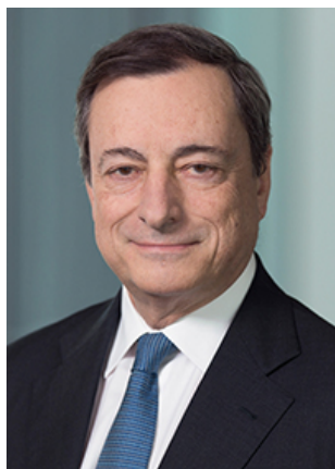
Mario Draghi (Mario Draghi) Eiropas Sistēmisko risku kolēģijas priekšsēdētājs

Eiropas Sistēmisko risku kolēģijas (ESRK) septītais gada pārskats aptver laikposmu no 2017. gada 1. aprīļa līdz 2018. gada 31. martam. Pārskata periodā ESRK turpināja rūpīgi monitorēt sistēmisko risku avotus Eiropas finanšu sistēmā un tautsaimniecībā un identificēja četrus galvenos riskus, kas apdraud finanšu stabilitāti Eiropas Savienībā (ES). Šā darba ietvaros ESRK analizēja norises komerciālo nekustamo īpašumu un nebanku finanšu sektorā.