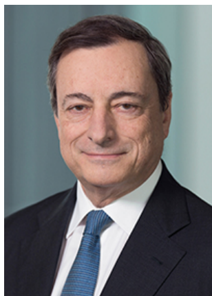
Mario Draghi Europos sisteminės rizikos valdybos pirmininkas

Tai septintoji Europos sisteminės rizikos valdybos (ESRV) metų ataskaita. Ji apima laikotarpį nuo 2017 m. balandžio 1 d. iki 2018 m. kovo 31 d. Visą apžvelgiamą laikotarpį ESRV ir toliau akylai stebėjo sisteminės rizikos šaltinius Europos finansų sistemoje ir ekonomikoje ir įvardijo keturias didžiausias rizikas finansiniam stabilumui Europos Sąjungoje (ES). Dirbdama šioje srityje ESRV analizavo pokyčius komercinės paskirties nekilnojamojo turto ir ne bankų finansų sektoriuose.