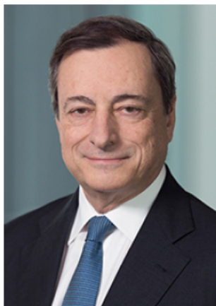
Марио Драги, председател на Европейския съвет за системен риск

Това е шестият годишен доклад на Европейския съвет за системен риск (ЕССР), който обхваща периода от 1 април 2016 г. до 31 март 2017 г. През отчетния период ЕССР продължи да наблюдава внимателно уязвимите места от финансовата система на Европейския съюз (ЕС) и да допринесе към политическия дебат в тази област. ЕССР обърна специално внимание на две важни рискови области. Първата е свързана с рисковете, породени от условията на трайно ниски лихвени нива. Анализът на тези рискове, извършен съвместно от ЕССР и ЕЦБ, беше публикуван в доклад по проблемите на макропруденциалната политика, породени от ниските лихвени проценти. Този анализ също така бе причината ЕССР да разглежда установения риск от слабости в балансите на банките, застрахователните дружества и пенсионните фондове като един от двата най-явни риска за финансовата стабилност в ЕС, поставяйки го наравно с риска от преоценка на рисковите премии на световните финансови пазари.