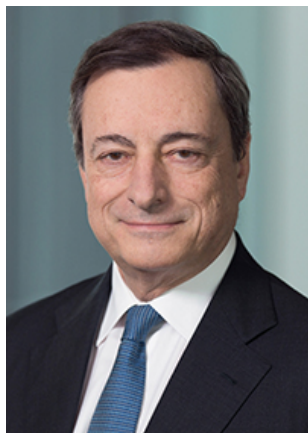
Mario Draghi, predseda Európskeho výboru pre systémové riziká

V priebehu roka 2015 Európsky výbor pre systémové riziká (European Systemic Risk Board – ESRB) pokračoval v dôslednom monitorovaní možných zdrojov systémových rizík v európskom finančnom systéme a ekonomike. V troch oblastiach sa miestami prejavili známky zhoršenia zraniteľnosti. Predovšetkým bola zaznamenaná výrazná volatilita na trhu, vyvolaná vývojom v kľúčových rozvíjajúcich sa trhových ekonomikách na jeseň 2015, ktorá sa rýchlo rozšírila na svetové finančné trhy vrátane európskych. ESRB sledoval riziko preceňovania na svetových finančných trhoch a v reakcii na tento vývoj ho aktualizoval na najvyšší stupeň. Na začiatku roka 2016 sa táto zraniteľnosť čiastočne premietla do prostredia, ktoré sa vyznačovalo pokračujúcou neistotou, pokiaľ ide o oživenie svetovej ekonomiky, pretrvávajúcimi nedostatkami v súvahách bánk a poisťovní v EÚ a vysokou úrovňou verejného a súkromného dlhu. Po druhé sektor tieňového bankovníctva EÚ čo do veľkosti i previazanosti aj naďalej rástol, čo predstavuje riziko prenosu potenciálnych šokov a kontaminácie zo sektorov tieňového bankovníctva na zvyšok finančného systému. Pod naďalej zvýšenú úroveň obáv sa v neposlednom rade podpísala geopolitická neistota v takmer všetkých okolitých regiónoch Európy.