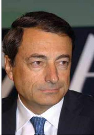
Mario Draghi az ERKT elnöke

Örömmel mutatom be az Európai Rendszerkockázati Testület (ERKT) harmadik éves jelentését. Az ERKT-t 2010-ben hozták létre az Európai Unió (EU) független szerveként, és feladatául az EU pénzügyi rendszerének makroprudenciális felvigyázását kapta. A jelentés a 2013. április 1. és 2014. március 31. közötti időszakot tekinti át.