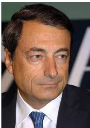
Mario Draghi Président du Comité européen du risque systémique

Je suis heureux de présenter le troisième Rapport annuel du Comité européen du risque systémique (CERS), organe indépendant de l'Union européenne (UE) chargé, depuis 2010, de la surveillance macroprudentielle de son système financier. Le Rapport couvre la période comprise entre le 1 er avril 2013 et le 31 mars 2014.