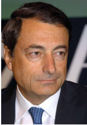
Mario Draghi EJRK:n puheenjohtaja

Tämä on Euroopan järjestelmäriskikomitean (EJRK) toinen vuosikertomus. EJRK on riippumaton Euroopan unionin (EU) elin, joka vastaa rahoitusjärjestelmän makrovakauden valvonnasta unionissa. Se saa Euroopan keskuspankilta (EKP) tarvitsemansa sihteeristöpalvelut sekä analyyttistä, tilastollista, logistista ja hallinnollista tukea.