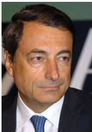
Mario Draghi Ordförande för Europeiska systemrisknämnden

Jag är mycket nöjd att kunna presentera Europeiska systemrisknämndens (ESRB) första årsrapport. ESRB upprättades i december 2010 som ett oberoende organ inom Europeiska unionen (EU) och har ansvar för makrotillsynen av unionens finanssystem.