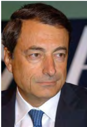
Mario Draghi Voorzitter van het Europees Comité voor Systeemrisico's

Het doet mij veel plezier hierbij het eerste Jaarverslag van het Europees Comité voor Systeemrisico's (European Systemic Risk Board ofwel ESRB), dat in december 2010 is opgericht als een onafhankelijk orgaan van de Europese Unie (EU) verantwoordelijk voor het macro-prudentieel toezicht op het financiële stelsel van de EU, te presenteren.