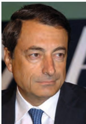
Mario Dragi Eiropas Sistēmisko risku kolēģijas priekšsēdētājs

Priecājos par iespēju iepazīstināt ar pirmo gada pārskatu, ko sagatavojusi Eiropas Sistēmisko risku kolēģija (ESRK), kas izveidota 2010. gada decembrī kā neatkarīga Eiropas Savienības (ES) struktūra, kura ir atbildīga par ES finanšu sistēmas makrouzraudzību.