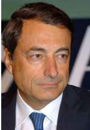
Mario Draghi az ERKT elnöke

Örömmel mutatom be az Európai Rendszerkockázati Testület (ERKT) első Éves jelentését. A 2010 decemberében alapított független európai uniós (EU) testület feladata az unió pénzügyi rendszerének makroprudenciális felvigyázása.