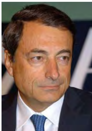
Mario Draghi Presidente de la Junta Europea de Riesgo Sistémico

Me complace presentar el primer Informe Anual de la Junta Europea de Riesgo Sistémico (JERS), creada en diciembre de 2010 como organismo independiente de la Unión Europea (UE) encargado de la supervisión macroprudencial de su sistema financiero.