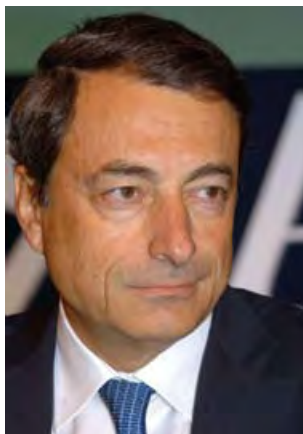
Mario Draghi předseda Evropské rady pro systémová rizika

S potěšením Vám předkládám první Výroční zprávu Evropské rady pro systémová rizika (ESRB), která byla založena v prosinci 2010 jako nezávislá instituce Evropské unie (EU) odpovědná za makroobezřetnostní dohled nad finančním systémem.