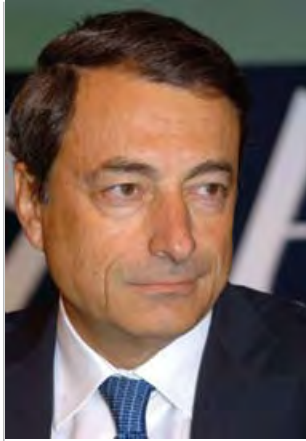
Марио Драги Председател на Европейския съвет за системен риск

Удоволствие за мен е да представя първия Годишен доклад на Европейския съвет за системен риск (ЕССР), който е създаден през декември 2010 г. като независим орган на Европейския съюз (ЕС) и отговаря за пруденциалния надзор на макроравнище на неговата финансова система.